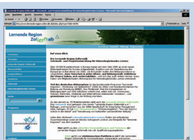
Internet-Startseite des Modellprojekts

Gerade ein Netzwerk mit gleichrangigen Partnern, die unterschiedliche Arbeitskulturen mitbringen, braucht ein effizientes Management. In der Lernenden Region Zollernalb leistet dies die GiMA consult mbH. Neue Ideen werden etwa auf regelmäßigen Partnertreffen mit einer speziellen Technik der Großgruppenmoderation ausgeklügelt. Indem sich die Netzwerkpartner gegenseitig anregen und anspornen, entstehen Angebote hoher Qualität – und immer wieder unerwartete neue Vernetzungsmöglichkeiten. Für diese Qualität wird künftig das Qualitätssiegel „Mitglied der Lernenden Region Zollernalb“ mit definierten Kriterien bürgen.