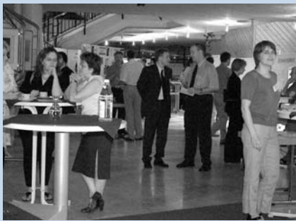
Gespräche auf der Bildungsmesse am 24.06.03 in Balingen

Und so müssen zukunftsweisende Bildungsangebote gerade