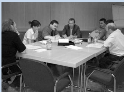
Gemeinsame Arbeit bei einem Partnertreffen

In einer Lernenden Region heißt das Zauberwort ‚Vernetzung‘. Rund 30 Netzwerkpartner arbeiten seit 2001 an neuen Bildungschancen im Zollernalbkreis und in angrenzenden Gemeinden. Es sind ungewöhnliche neue Partnerschaften: Denn hier wirken Institutionen zusammen, die zuvor oft gar keine Berührung miteinander hatten. Etwa Unternehmen, Behörden, Schulen, Hochschulen, Bildungsanbieter der Erwachsenenpädagogik, Verbände, Kammern und soziale Einrichtungen.