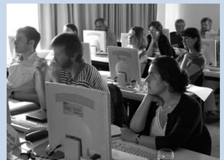
Partner bei der Autorenschulung im Juni 2004 in Hechingen

Diese Kooperationen ermöglichen es z.B. Unternehmen, Bildungsangebote selbst mitzugestalten – und machen neue Lernformen wie die Kombination von e-Learning