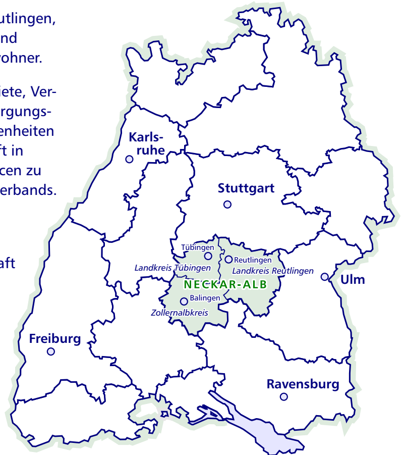
REGION NECKAR-ALB LEBENS- UND WIRTSCHAFTSRAUM

Der Regionalverband handelt in eigener Verantwortung. Rechtliche Grundlage ist das Landesplanungsgesetz Baden-Württemberg.